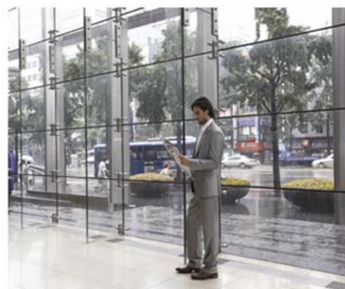
DIGITAL WDR ON

CITLALTZIN No. 3 COL. RICARDO FLORES MAGON MEXICO, D.F.