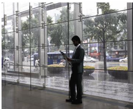
DIGITAL WDR OFF

Nuestra cámara cuenta con DWDR, esta función se encarga de medir, compensar y ajustar la luz en la imagen captada para después combinar los espacios de luces brillantes con los espacios de sombras que hay en una misma toma, creando un equilibrio en la imagen final.